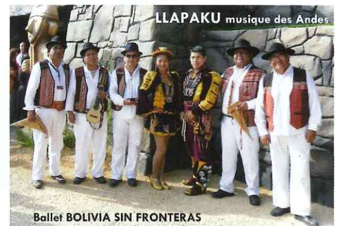
Ballet BOLIVIA SIN FRONTERAS

Entrée : 12 € (gratuite pour les scolaires et demi-tarif pour étudiants)